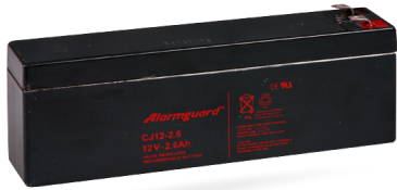
Bezúdržbový zálohovací akumulátor 12V.